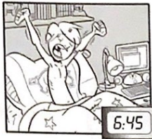
I get up at quarter to seven.

do my homework get home get up go to bed go to school have a shower have breakfast have dinner have lunch